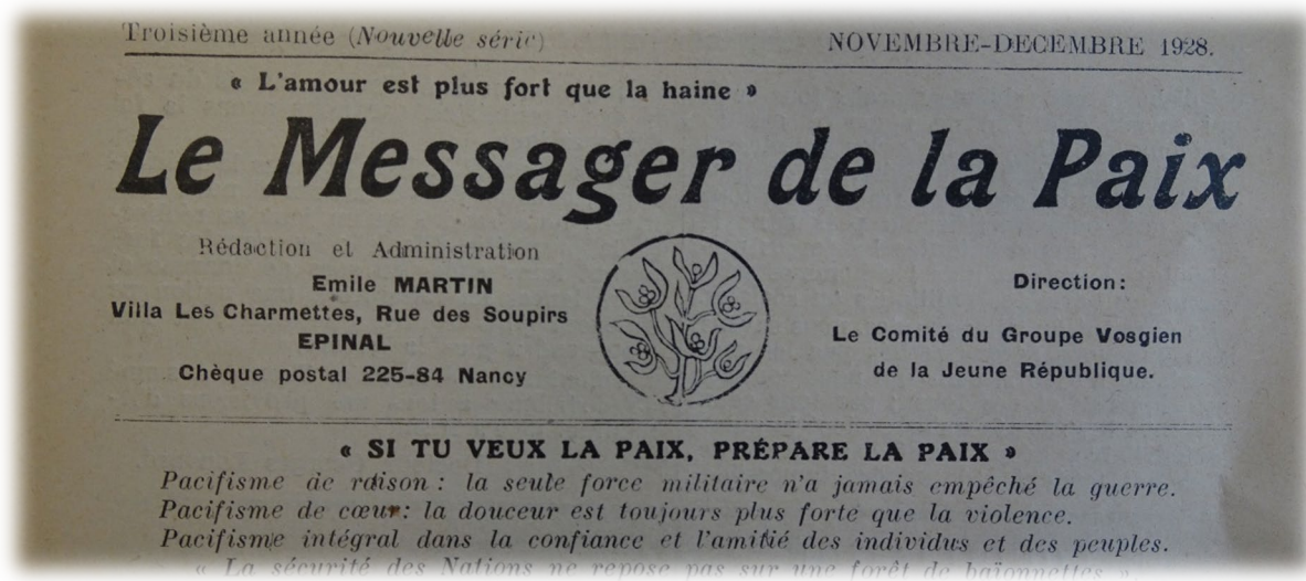
Figure 1- En-tête d'une presse pacifique vosgienne d'après-guerre

Guerre de nationalisme pour les uns, de revanche pour les autres, le conflit qui éclate en Europe dans le courant de l'été 1914, attendu sinon désiré par la plupart des dirigeants politiques, ne devait durer que quelques mois. La réalité fut autre ! Durant quatre longues années, cette guerre rapidement devenue mondiale - la première du genre - sévit plus intensément qu'ailleurs sur le sol français, en particulier entre Vosges et mer du Nord où elle s'enlise dans une guerre de position, autrement dit une guerre d'usure éprouvante et meurtrière pour les troupes, cantonnées de part et d'autre des tranchées, autant que pour les civils vivant à proximité du front ou soumis aux aléas d'une guerre totale absorbant l'ensemble des ressources humaines et financières.