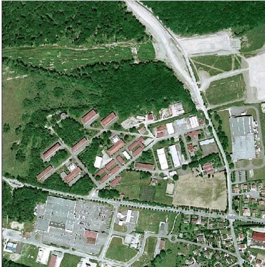
C'était la BA 902 - les fouilles et sondages archéologiques