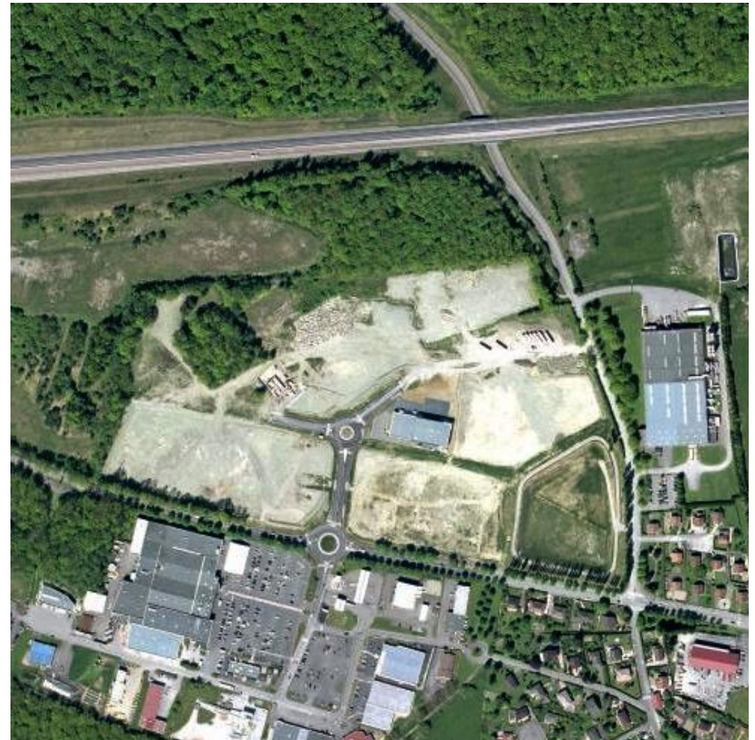
ça a changé et ça changera encore....